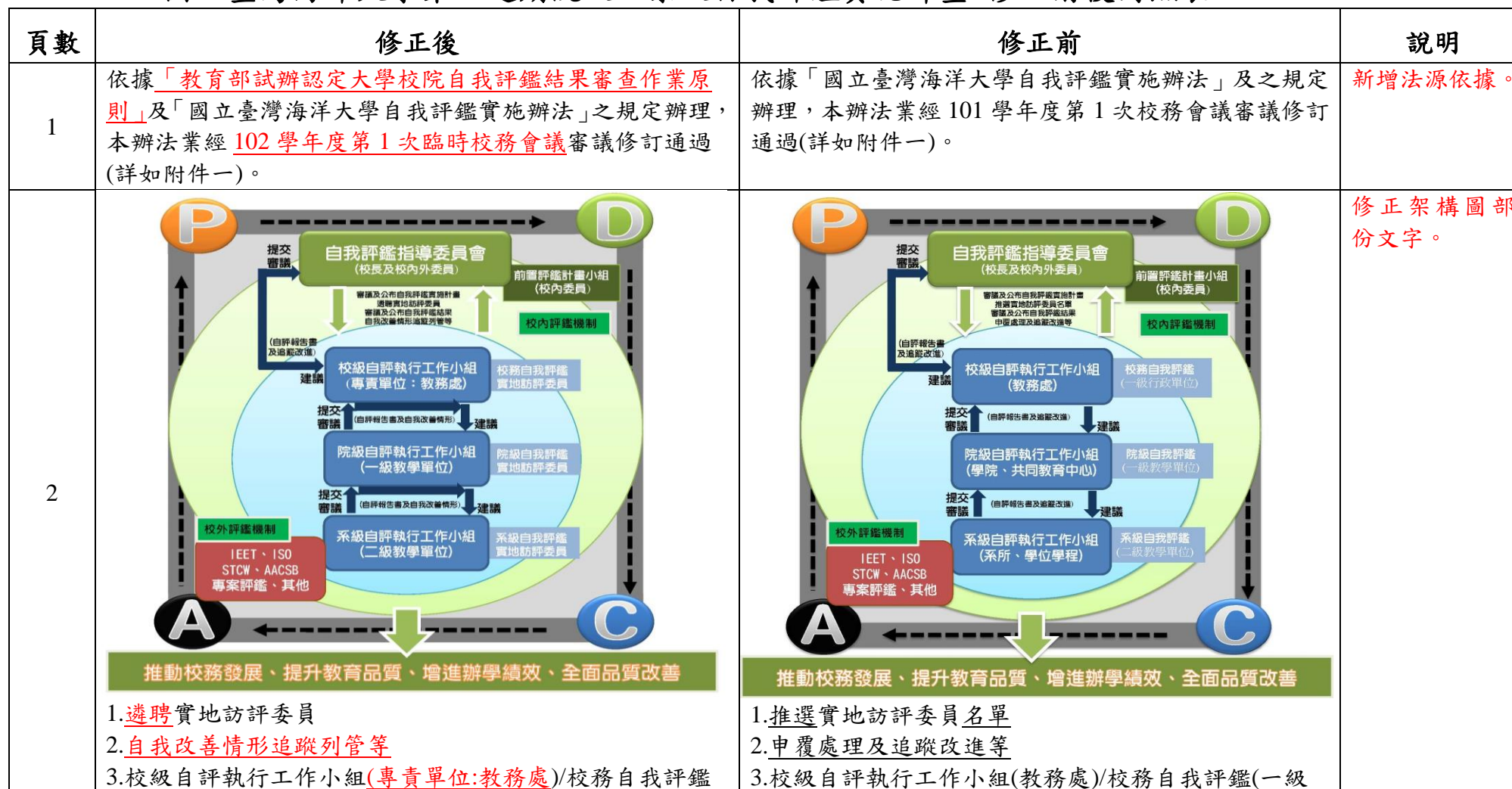
國立臺灣海洋大學第二週期院級、系級自我評鑑實施計畫 修正前後對照表 102.11.19